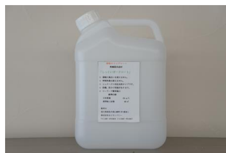
4kg (約 20 m 2 分)